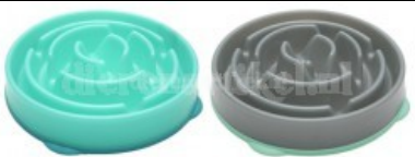
Slo-bowl feeder Drop