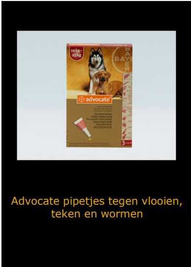
Advocate pipetjes tegen vlooiën, teken en wormen