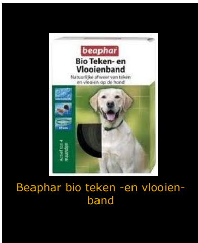
Beaphar bio teken -en vlooiënband