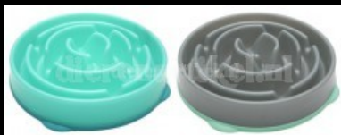
Slo-bowl feeder Drop