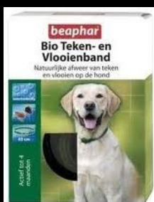
BEAPHAR BIO teken- en vlooiensband