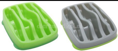
Slo-bowl feeder Hills